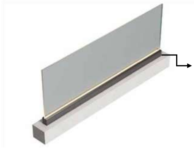
Dimmerli LED Şerit Aydınlatma Sistemi